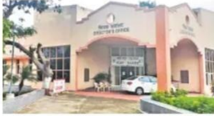
రాజేంద్రనగర్లోని నార్మ్ పరిపాలనా కార్యాలయం